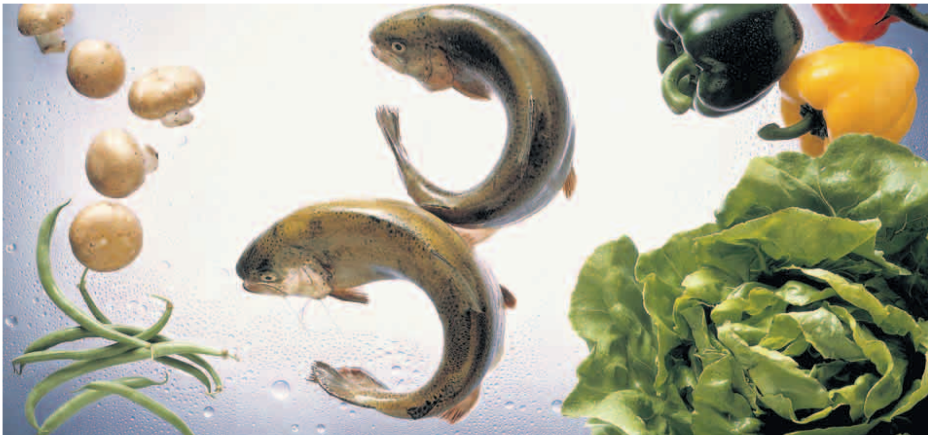
Viel Gemüse und dazu eiweißreiche Beigaben wie Fisch. Eine solche Diät soll große Geschwüre am Wachstum hindern. Doch der wissenschaftliche Nachweis steht noch aus

Doch eine solche Diät kommt nicht für jeden Patienten infrage. Sie ist ausschließlich bei weit fortgeschrittenen Tumoren sinnvoll, die bereits auf die Milchsäuregärung umgestellt haben. Ob das der Fall ist, lässt sich mithilfe einer Untersuchung mittels Positronen-Emissions-Tomografie (PET) feststellen. Die Zuckermenge, die ein Geschwür aufnimmt, ist bestimm-