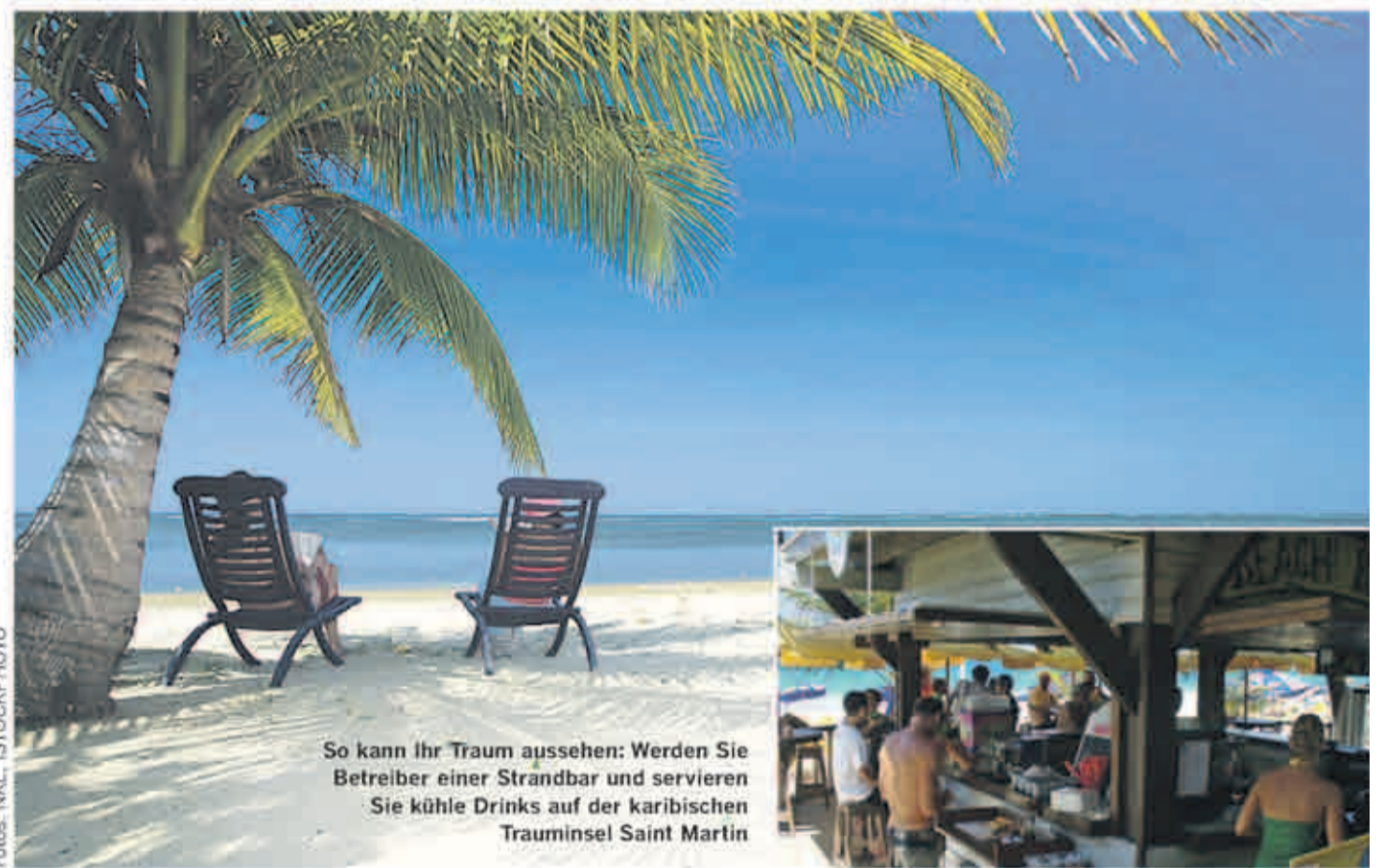
So kann Ihr Traum aussehen: Werden Sie Betreiber einer Strandbar und servieren Sie kühle Drinks auf der karibischen Trauminsel Saint Martin

Wir freuen uns auf Ihre Bewerbung. Einsendeschluss ist Freitag, der 9. Mai 2008.